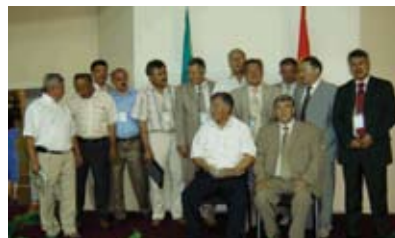
Казахско-Кыргызской комиссии на реках Чу и Талас.

Это позволило разрешить важный вопрос в водных отношениях в